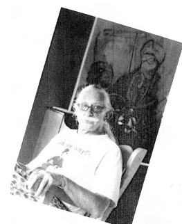
パッチ・アダムスこと Dr.ハンター・ドーター・アダムス (上がご本人)