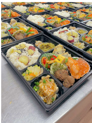
80個のお弁当が開始5分程で完配になるほどの大盛況だったようです。ご支援頂いた皆様に感謝申し上げます。