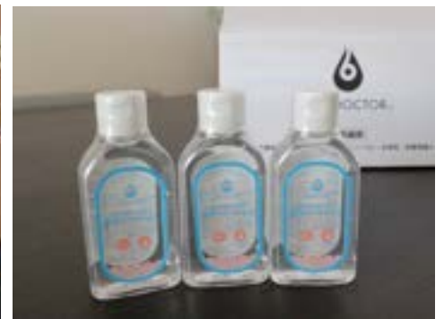
寄付した薬用ハンドジェル