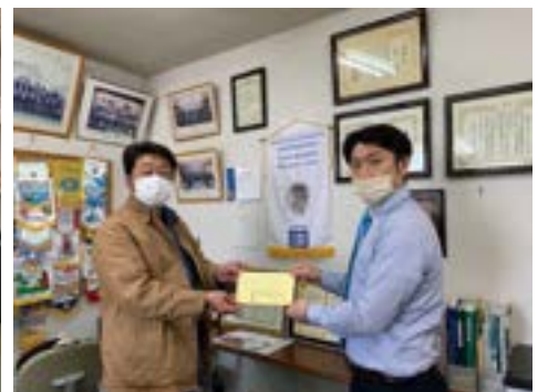
子ども食堂へ協賛金贈呈