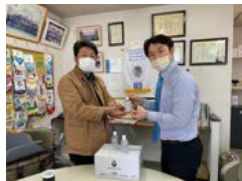
翡翠会へ薬用ハンドジェル寄付